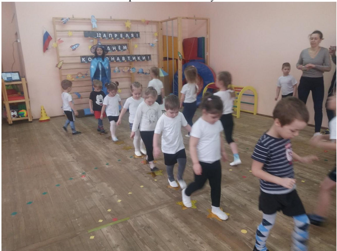
Игра «Звездная дорожка».