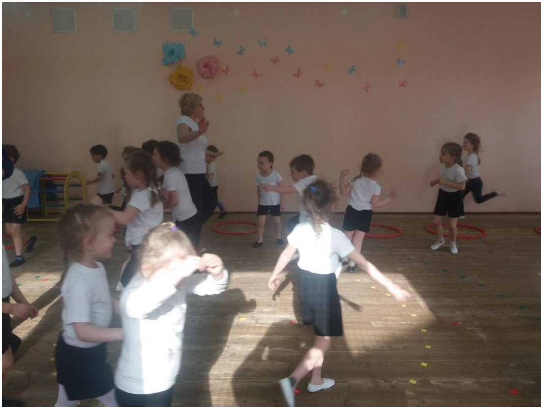
Игра «Займи планету»