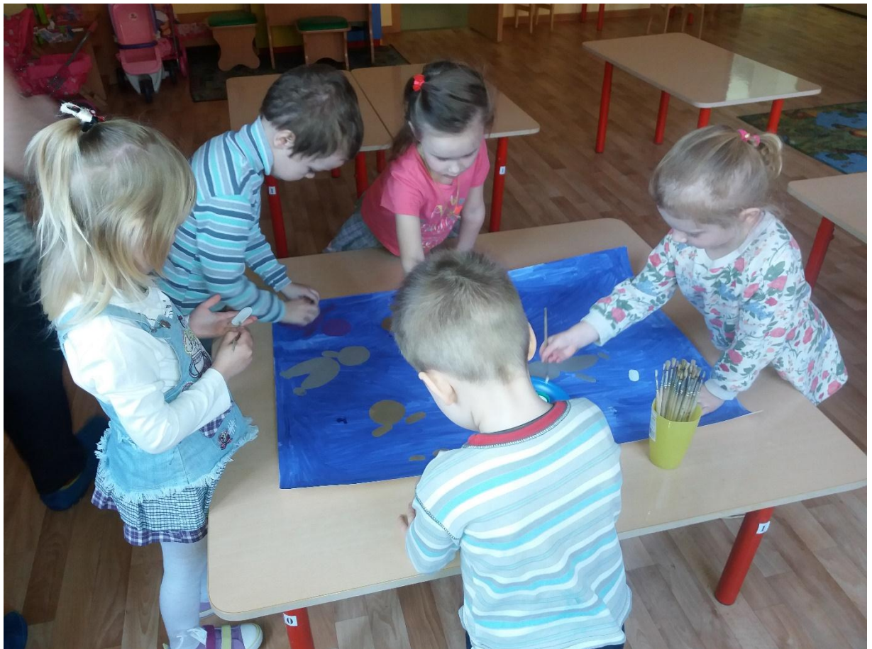
Коллективная работа «Космос»