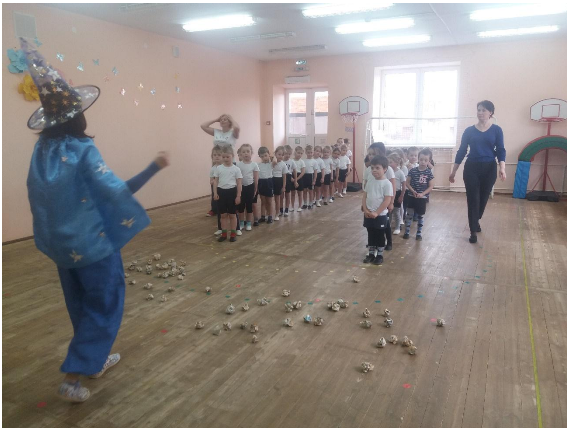
На луне космический мусор. Игра «Космические уборщики».