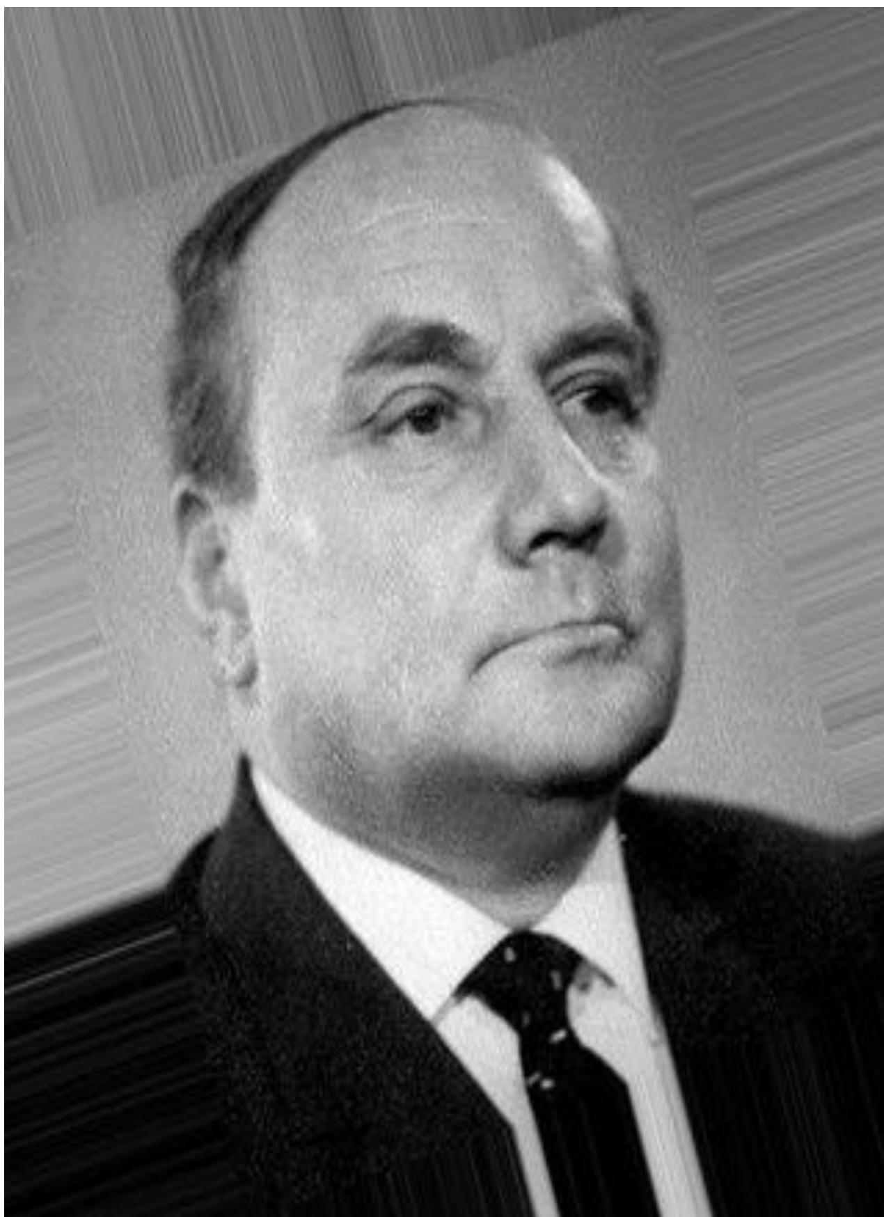
Владимир Григорьевич Сутеев