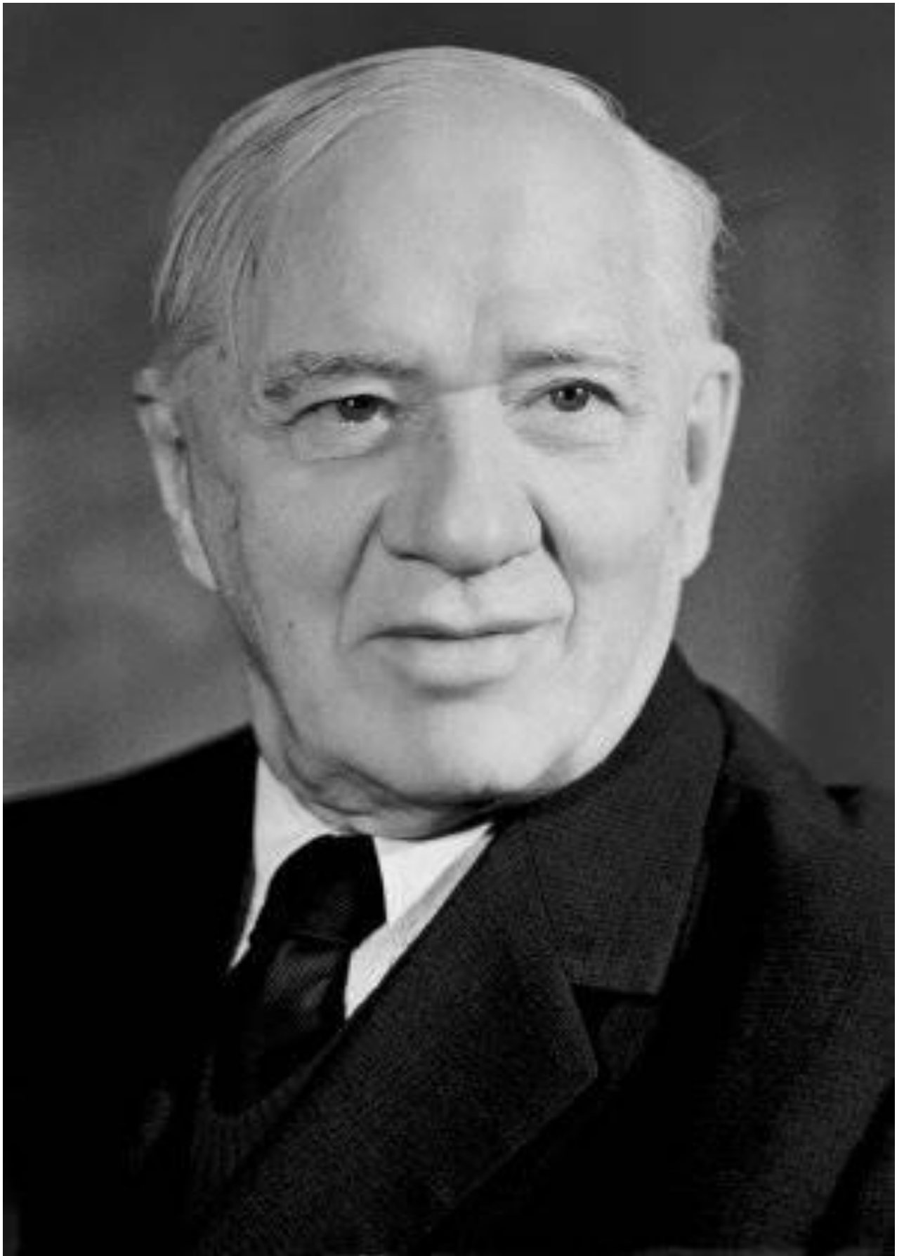
Корней Иванович Чуковский