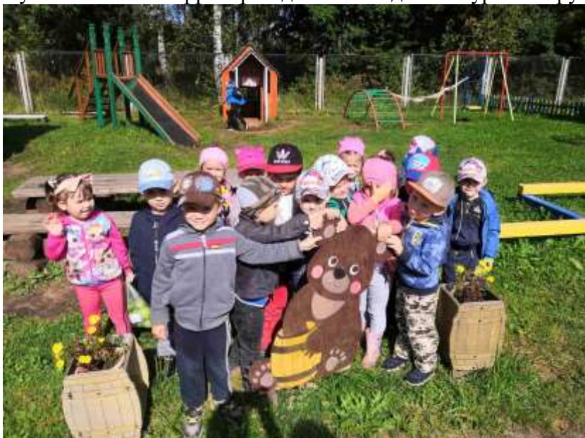
Путешествие по территории детского сада. Экскурсия в группу «Лисята»