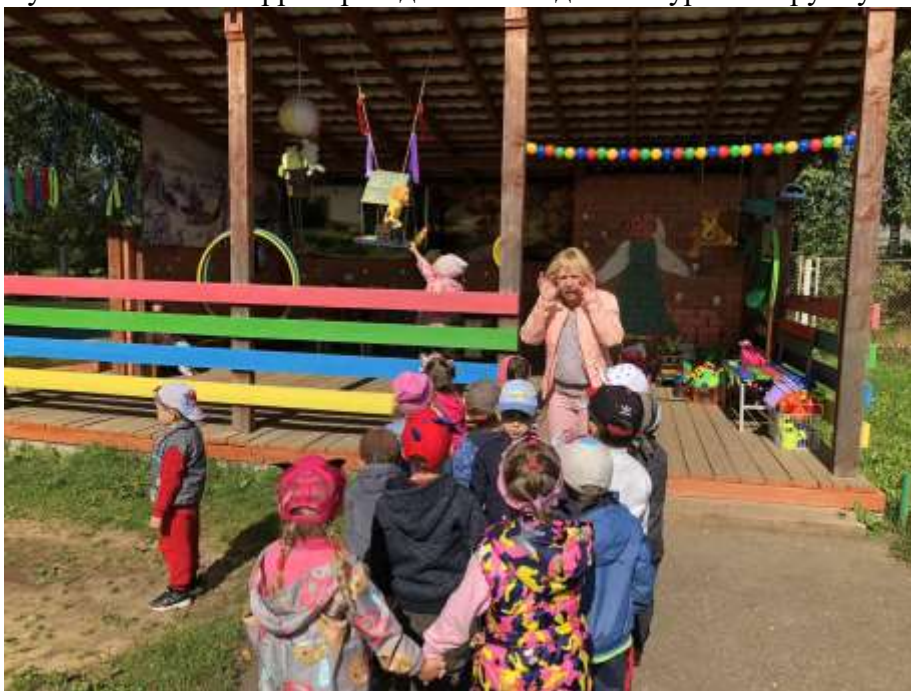
Путешествие по территории детского сада. Экскурсия в группу «Зайчата»